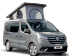
GRIS URBAIN OPTION