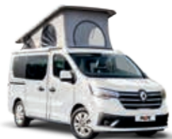
BLANC DE SÉRIE