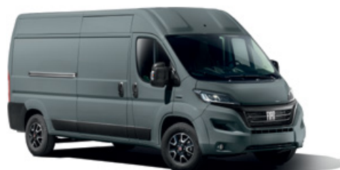
GRIGIO LANZAROTE OPTIONAL