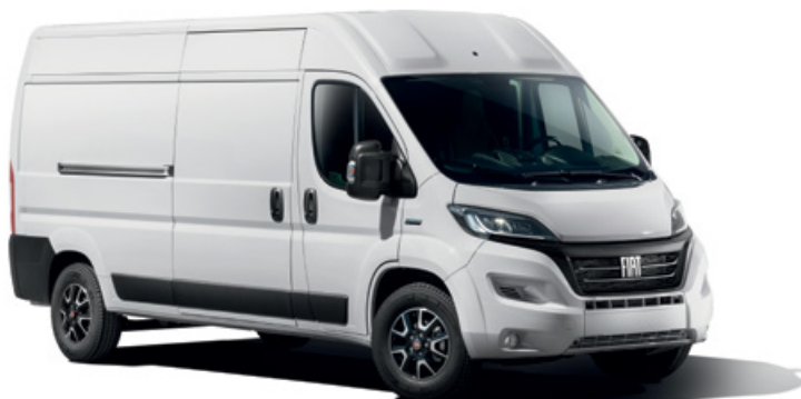
BIANCO DI SERIE