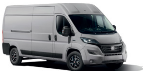
GRIGIO CAMPOVOLO OPTIONAL